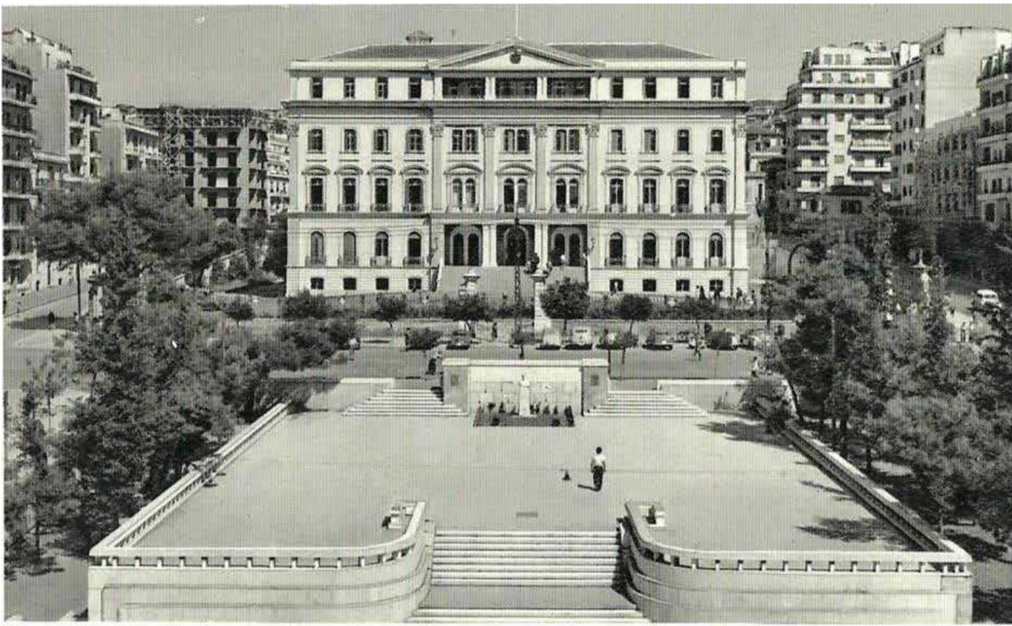
Δ-491 ΘΕΣΣΑΛΟΝΙΚΗ. Τό Διοικητήριο THESSALONIKI. Le Palais du Gouverneur